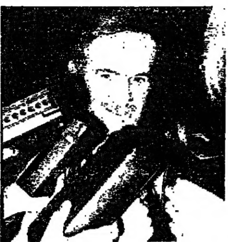
آلات التسجيل في إحدى المحطات اللبنانية تسجل الصور مع الرئيس حافظ الأسد

مازق أمريكي أم عربي؟ خلاصة رحلة سيرة الرئيس هي ترك الشرق الأوسط في حالة الشك على حد كبير المعلق الأمريكي جيمس راسون. وهذه الحالة أصعب من حالة اللباس والمخبر، فلا الدول العربية والتمتع من الضبط الأمريكي على إسرائيل % أو من صدور قرار أمريكي يوقف تمويل إسرائيل، تهدد المصالح الأمريكية. ولاسرائيل والتمتع من عدم حدوث الضبط الأمريكي. ولا أمريكا تحافظ على مستنصر، ولا التي تصرف أين تقف وإلى أين هي ذاهبة.